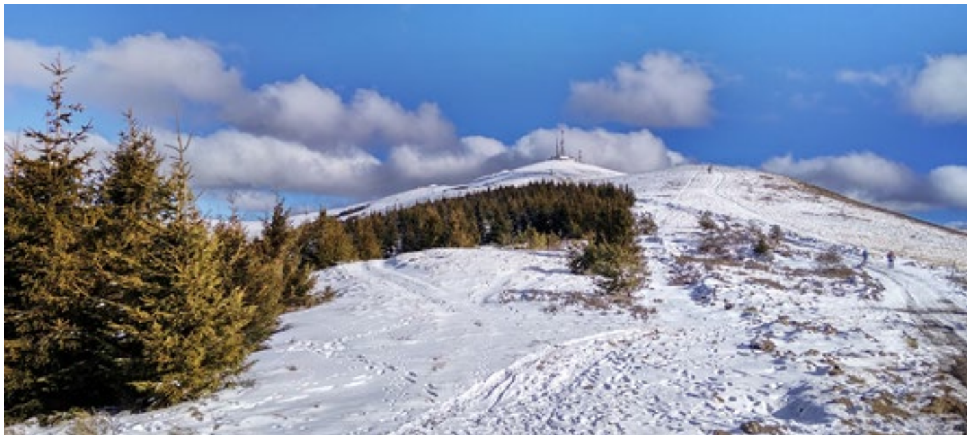
Бесна Кобила

ВАРДЕНИК - Велики (1876 мнв) и Мали Стрешер (1757 мнв)